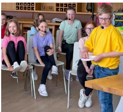
Die ELISA -Geschwisterkinder mit ihrem selbst entwickelten Theaterprojekt „Farbenspiel – ein Theaterstück über unsere Emotionen“, aufgeführt bei der ELISA -Jubiläumsfeier.

In unserem Jubiläumsvideo nehmen wir Sie mit auf eine bewegende Reise durch 25 Jahre ELISA Familiennachorge.