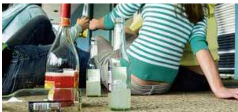
130 Jugendliche wurden im Jahr 2011 in den Kliniken wegen Alkoholmissbrauch behandelt. Die Betreuung wird deshalb mit der Caritas ausgebaut.

Am 3. Dezember berichteten wir über das letzte große Möbelgeschäft „Pummers Wohnwelt“, das in der Innenstadt die Türen schließt. Mit der Wohnideen-Einrichtung GmbH an der Münchner Straße verbleibt aber ein, wenn auch wesentlich kleineres Möbelgeschäft im Innenstadtbereich. (nr)